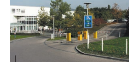
Ansicht: Anfahrt Haupteingang, Parkhaus/-deck

Klinikum Dritter Orden Haupteingang: Menzinger Straße 44