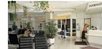
Haupteingang, Information, Treppenaufgänge, Aufzüge zu den Stationen

P Parken: Menzinger Straße, Franz-Schrank-Straße, In den Kirschen.