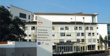
Ansicht: Notaufnahme, Nachtpforte und Warenannahme

Klinikum Dritter Orden Eingang: Franz-Schrank-Straße 8 Kinderklinik, Geburtshilfe