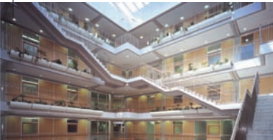
Kinderklinik Atrium, Treppenaufgänge, Aufzüge zu den Stationen